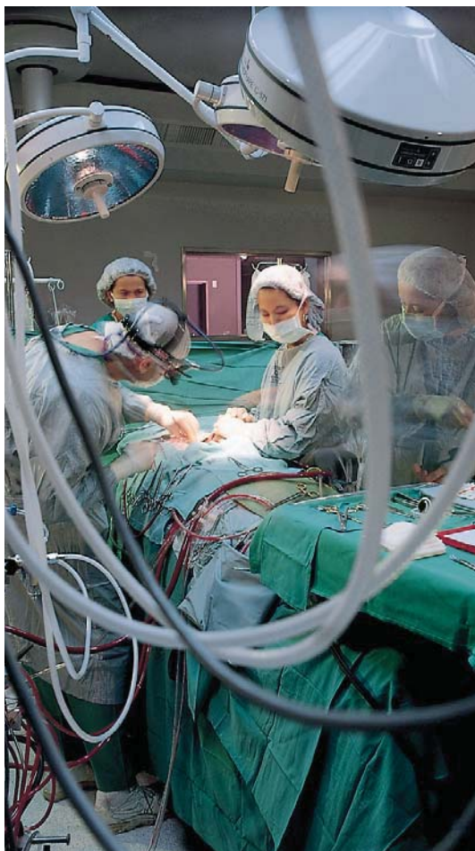
Saare Zedek Hastanesinin izniyle