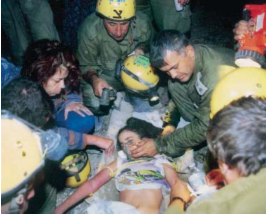
İSK Arama ve Kurtarma Ekibi faaliyet halinde (Türkiye'de depremden sonra)

Düzgün sağlık hizmetinin ideoloji bariyerlerini ve siyasi sınırları aşan evrensel bir hak olduğu inancına uygun olarak, İsrail hastaneleri onların uzmanlığından yararlanmak isteyen herkese açıktır. Yıllar boyunca, dünyanın her yerinden, hatta İsrail ile diplomatik ilişkileri bulunmayan ülkelerden bile, hastalar uzmanlık tedavisi için gelmişlerdir. Asya ve Afrika'nın birçok yerinde, İsraili doktorlar ve hemşireler, gelişmiş ülkelerde hemen hemen tümüyle yok edilmiş olan hastalıkların tedavisinde yardım sunmakta ve değişim programları kapsamında yerli sağlık personeliyle becerilerini paylaşmaktadır. Söz konusu programlardan bazıları Dünya Sağlık Teşkilatı himayesinde düzenlenmiştir. İsrail sağlık ekipleri felaket bölgelerindeki kurtarma çalışmalarına da katılırlar.