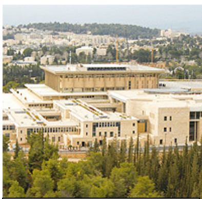
La Knesset, el parlamento israelí

De una población israelí cercana a los 8 millones, el 21% son árabes – 1.6 millones (casi todos musulmanes: 154 mil son cristianos y 130 mil drusos).