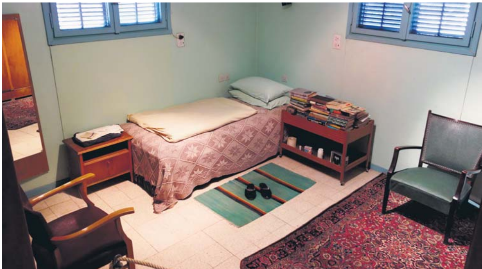
ಬೆನ್ ಗುರಿಯನ್ ವಿಶ್ರಾಂತಿ ಕೊಠಡಿ