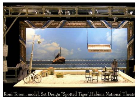
Roni Toren , model, Set Design "Spotted Tiger",Halima National Theatre